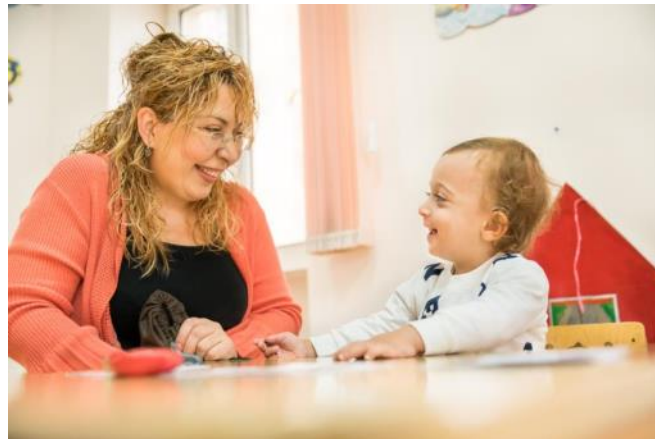
a Sonova Group initiative